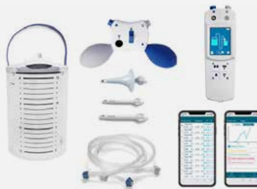
Navina Smart und Navina Classic.

TAI hat bei 79-100% der LARS-Patienten eine positive Wirkung 5,7 .